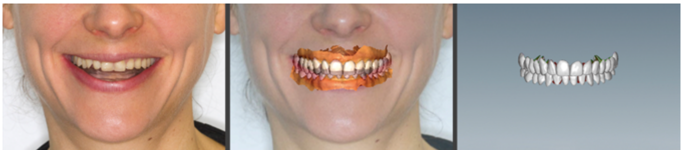
Abb. 6: Virtuelle Simulation der zukünftigen Rehabilitation in der neu definierten Bisshöhe (+ 7 mm) mit gesichtsbezogener Planung

Methoden eine größtmögliche Voraussagbarkeit der zukünftigen „Full-Mouth-Rehabilitation“ ermöglicht. Nach dem Motto „begin with the end in mind“ wird bereits vor der Behandlung das Endergebnis getestet. Über einen voll digitalen Arbeitsablauf kann sowohl das virtuelle Design der zukünftigen Zähne gemeinsam mit dem Patienten, mit der Patientin begutachtet als auch dieses nachfolgend in Form eines computerunterstützt an-