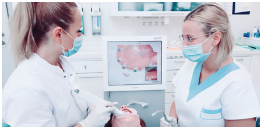
Abb. 1: Intraoralscan (CAI – Computer Aided Impression)

Durch die reduzierte Zahnschubstanz ist nicht nur die Zahnästhetik, sondern durch die Verminderung der vertikalen Bisshöhe auch die untere Gesichtshöhe betroffen, die damit Auswirkungen auf die Gesichtsästhetik hat. Spätestens wenn sich die negativen Folgen auf das Lächeln und Lachen auswirken, ist eine grundlegende Kommunikationsform des Menschen gestört, und es zeigen sich psychische Folgen wie Störungen des Selbstbewusstseins und Selbstwertgefühls. Kommen zusätzlich chronische