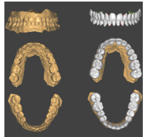
Abb. 7: a) Intraoral-Scan der Ausgangssituation b) Virtuelles Set-up der „Full-Mouth-Rehabilitation“

und Ästhetik einhergeht: Veränderungen der Bissituation, der Kauflächen und Führungsflächen der Zähne, der vertikalen Dimension, möglicherweise auch der sagittalen oder transversalen Dimension können eine massive Intervention für die betroffenen PatientInnen darstellen. Um die Erfolgsprognose einer komplexen restaurativen Therapie zu steigern, wird empfohlen, ein Maximum an Voraussagbarkeit von Ästhetik und Funktion