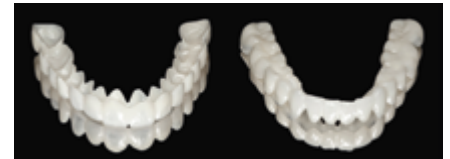
Abb. 8: CAD/CAM-gefertigtes, gefrästes abnehmbares Probegebiss

Die Verknüpfung der erhobenen virtuellen diagnostischen Daten mit dem Intraoralscan der PatientInnen ermöglicht eine CAD/CAM-gestützte Planung und virtuelle Simulation der finalen dentalen Versorgung. Das abnehmbare Probegebiss unterstützt den Patienten bzw. die Patientin über einen Test Drive, ein voraussagbares Endergebnis physisch zu bewerten. Um zukünftige Komplikationen zu vermeiden, bietet das digital unterstützte „Backward-Planning“ ein voraussagbares Endergebnis und dient als Schlüssel zum Erfolg in der „Full-Mouth-Rehabilitation“ mit dem Ziel, die Lebensqualität der PatientInnen über ein gesundes Lächeln mit optimierter Ästhetik und Funktion zu verbessern.