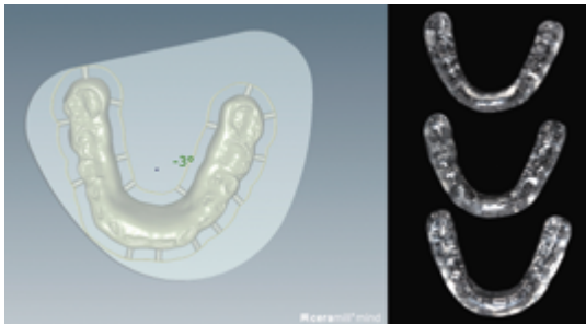
Abb. 3: CAD/CAM-gefertigte Schienen in verschiedenen Höhen (+5 mm, +7 mm, +10 mm)